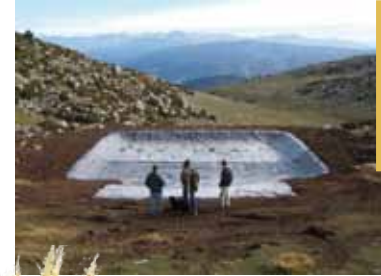
Accompagnement à la conception d'équipements pastoraux structurants