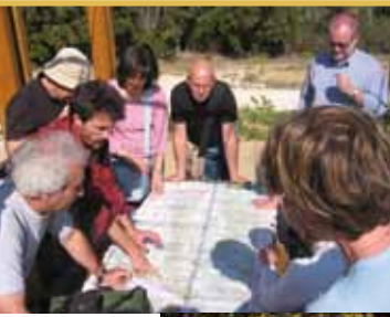
Concertation pour la gestion agri-environnementale