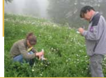
Suivi de végétation