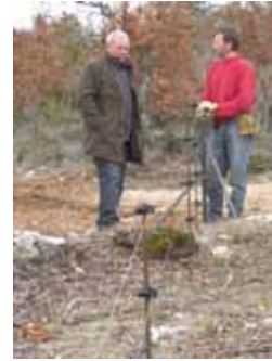
Équipements adaptés aux activités de chasse et de randonnée