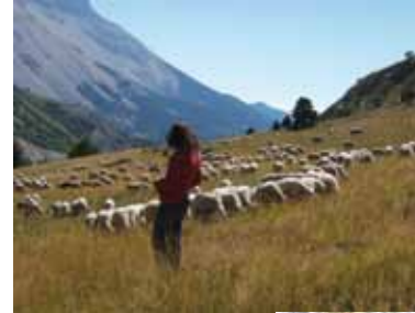
Expertise des pratiques pastorales